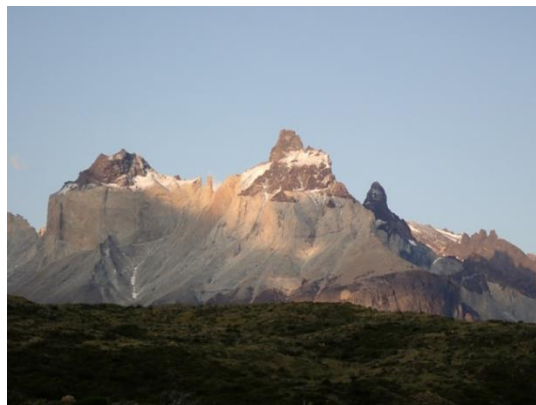
Dickson Lake からアルゼンチン側の氷河を臨む Paine Grande 小屋から Paine Grande Hill を見上げる

トレッキングは準備段階から楽しめる。開発プロジェクトをデザインする様に情報を集め、どの山に、いつ頃、誰とどのように行くかを決める。登山ウェア、道具、行動食を揃え、現地のロジの手配をすると、遠足前の小学生のように胸がワクワクしてくる。いよいよトレールを歩き出す。スマートフォンも使えない、自分の体だけが頼りのフィールドで、木や花に囲まれ、野や森を横切り、溪流を渡渉し、岩山を乗り越えていくと、都会生活ですっかり忘れていた本能的な感覚が蘇ってくるようだ。世界中から来たトレkker達との出会いもあり、一週間歩き続けると体も心もすっかりデトックスされる。