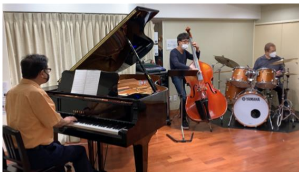
写真は仲間との練習風景

奏者が自由に演奏できる範囲が広い。ジャズの演奏とはクラシックでいう演奏と編曲を同時に行っているのかも知れない。従って、ジャズには「間違い」という概念がなく、クラシック音楽のように弾き間違いを指摘されることは少ない。一定の強さでピアノを弾くのではなく、強弱強弱と演奏して、リズム感を出す。加えて、ジャズには多くの場合に