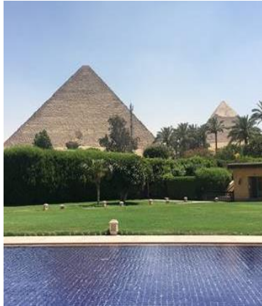
ギザのピラミッド群

カイロは歴史的な遺跡も多く、マリンスポーツ、ゴルフ、砂漠ツアーなど楽しめる場所が多いので、典型的な楽しい勤務地になっている。カイロの人口は2千万人を超えて、非常に混雑している。政府は新都市を建設し、首都を移転させる計画を進めている。そ