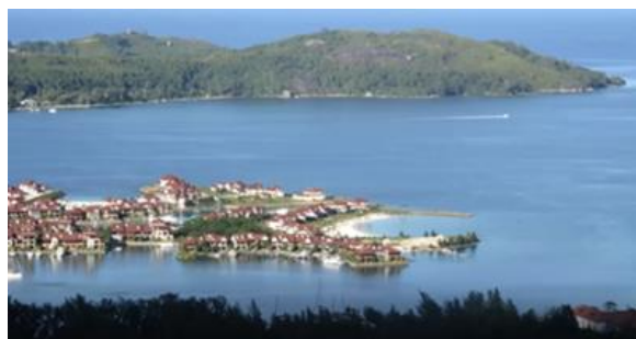
セイシェルズの港

インド洋にはモルジブ、セイシェルズ、モーリシャスなど、いずれも観光地として有名な美しい島々がある。モルジブでは海面上昇のため、飛行場から首都まで舟に乗らなければならなかった。ハネムーン旅行者にとっては天国のような環境であるが、リサイクルのシステムを作る資金も需要もないため、ごみ処理が大きな問題になっている。