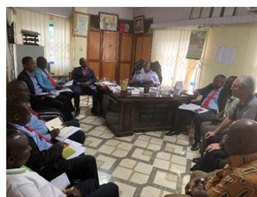
地方銀行の頭取等と協議 （2020.3、ガーナ）

日本から往復の移動日数も含めると、1 回当たりの出張日数は 1～3 週間、平均 2 週間として 65 回を掛けると 910 日間となります。この 10 年間、3,652 日のうち 1/4 の 2 年半は日本国外にいたという計算です。とりわけ、50 歳代後半になってからの直近 5 年間での延べ 50 か国への出張は、我ながら表彰ものだと思っています。海外出張は、まず事前の準備として、国際会議ならば参加登録から始まり、英文ペーパー（論文）の執筆と提出、滞在中のスケジュール作りと訪問先への連絡及びアポ取り、出張計画確定のための所内の手続き、航空券とホテルの手配、滞在先での足の確保（途上国の場合は運転手付きの車の借り上げ手配）、数千ドル程度の外貨の準備、調査出張の場合はさらに現地での調査のための諸準備が加わります。出張中は英語での業務、そして帰国後には出張報告書の作成、さらにはデータの整理や、旅費や海外で支払った資金の精算処理などフォローアップを行いますので、1 回の海外出張に要する時間とエネルギーはかなりのものになります。基本的にこれらの作業を全て一人でやりますので、50 歳代後半で年間平均 10 か国への出張は、よほど好きで慣れていなければこなせないだろうと思います。