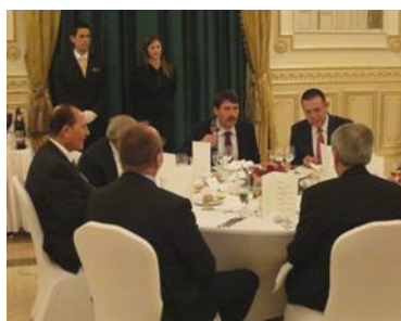
ハンガリー共和国アダー大統領主催晩餐会(2013.10)