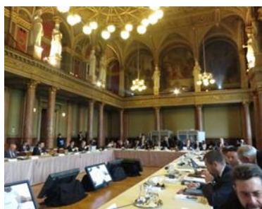
第50回 WWC 理事会 (2013.10、ブダペスト)

私はWWCの理事(Governor)として、3年間の任期中の理事会(マルセイユ、大邱、ブダペスト、慶州、メキシコシティ、マルセイユ、慶州&大邱、杭州、マルセイユ)には全て出席したほか、ストックホルム世界水週間会議にも3年連続で出席しました。また、WWCの運営に関する議論、並びに韓国で開催するWWF7の準備へ向けた議論の発展に貢献したほか、世界水遺産(WSH: World Water System Heritage)の認定登録制度をWWC理事会に提案し、ICIDが事務局となって運営する仕組みを制度化しました。