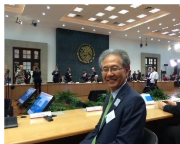
第52回 WWC 理事会 (2014.6、メキシコ大統領公邸で開催)