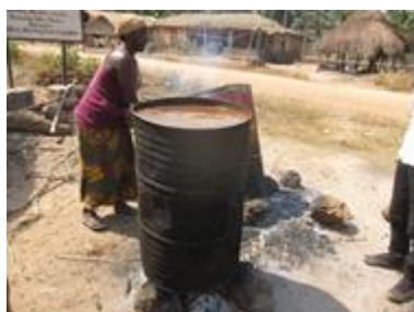
パーボイルドライスの煮沸 （2011.2、シエラレオネ）