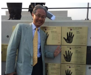
WWC 理事として記念手形 プレート寄贈（2015.4 韓国）