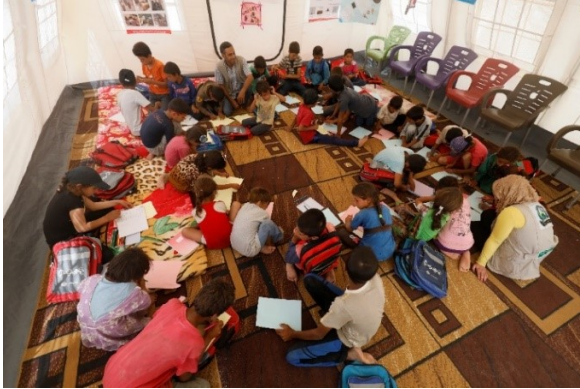
ユニセフが配布した学校鞆と文具で、学びはじめた子どもたち

が、いま最も支援を必要としているラッカやデリゾールの子どもたちの復帰に貢献するのを目の当たりにするのは、現場のスタッフとして非常に喜ばしく思う瞬間である。